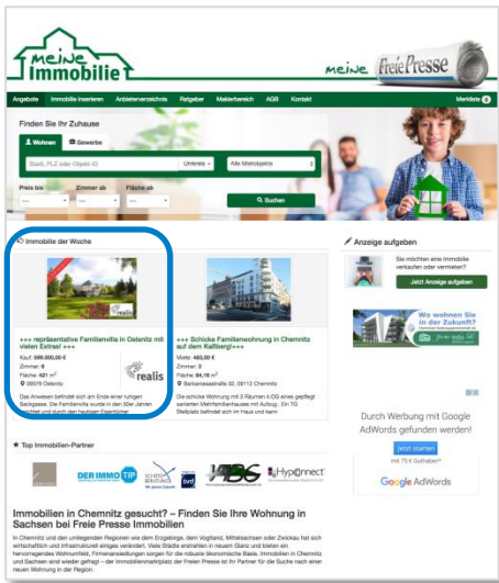
Top-Modul „Objekt der Woche“